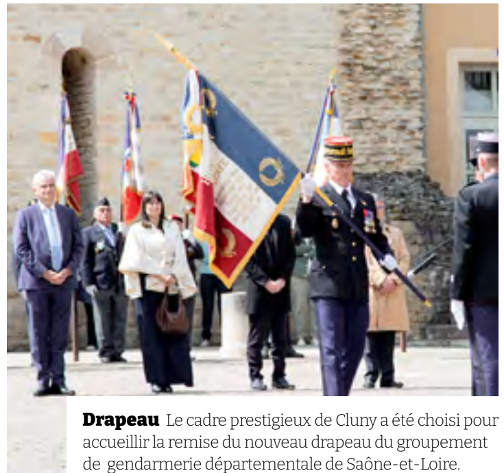
Drapeau Le cadre prestigieux de Cluny a été choisi pour accueillir la remise du nouveau drapeau du groupement de gendarmerie départementale de Saône-et-Loire.