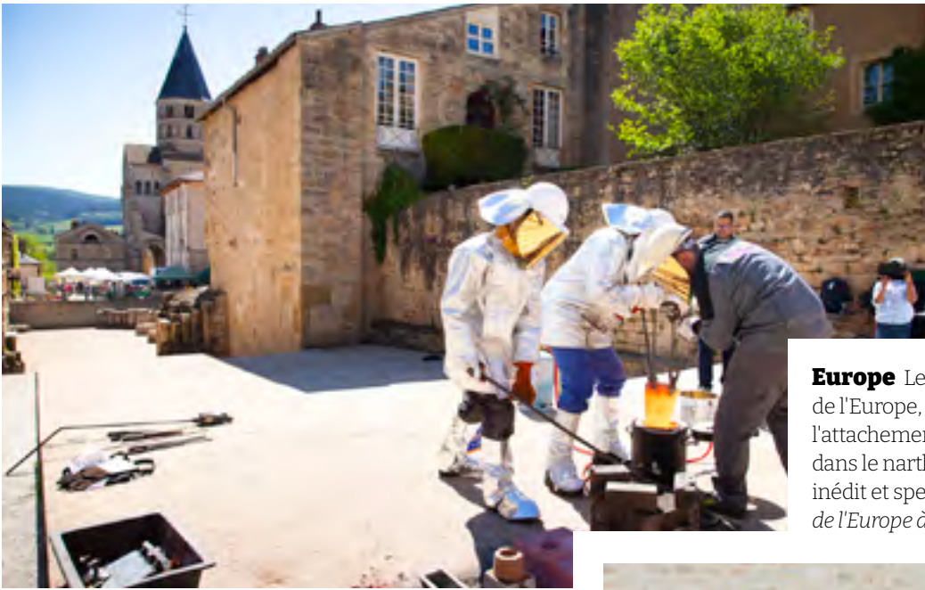
Europe Le 9 mai, à l'occasion de la Journée de l'Europe, une plaque symbolisant l'attachement de Cluny à l'Europe a été coulée dans le narthex de l'abbaye. Un événement inédit et spectaculaire proposé par la Maison de l'Europe à Cluny .