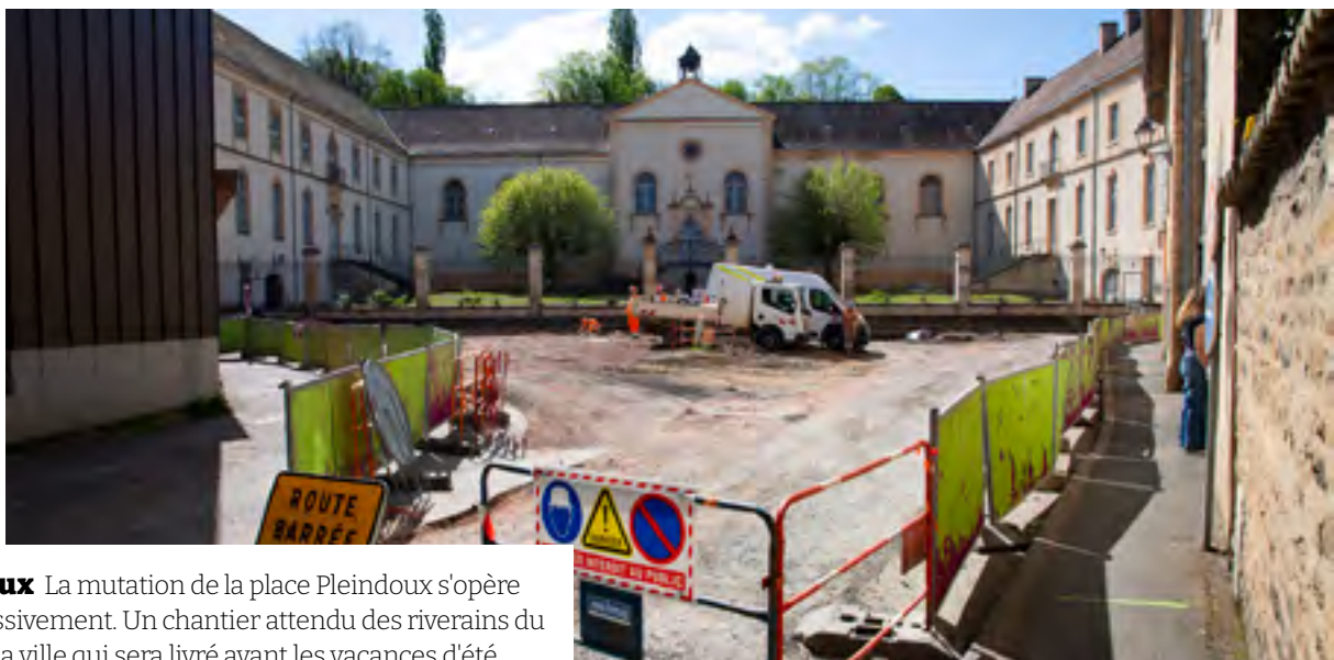
Travaux La mutation de la place Pleindoux s'opère progressivement. Un chantier attendu des riverains du bas de la ville qui sera livré avant les vacances d'été.