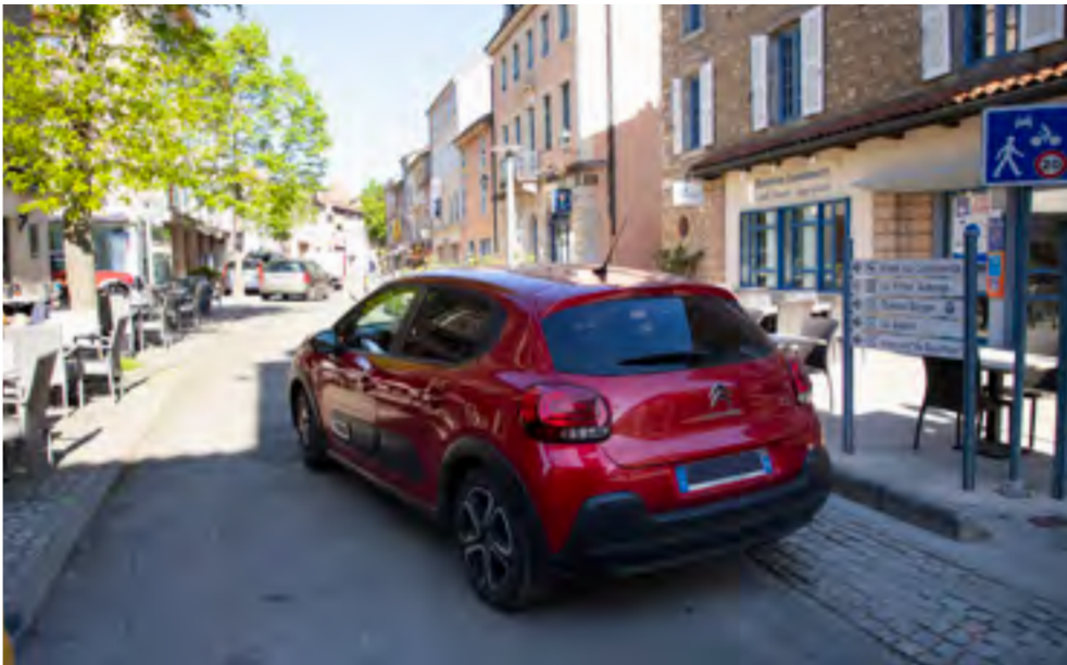
▲ Le retrait de la barrière de la place du Commerce simplifie l'accès au centre-ville.

Le 20 avril, la municipalité organisait une réunion publique consacrée à la circulation en centre-ville. Cette rencontre a permis de réunir habitants, commerçants et riverains autour d'un sujet régulièrement évoqué ces dernières années.