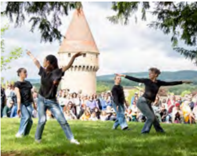
Danse Malgré une météo pas toujours favorable, le festival Cluny Danse a comme chaque année fait vibrer la ville au rythme de spectacles de grande qualité.