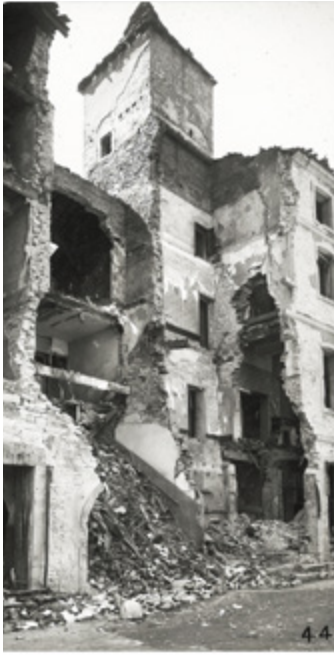
▲ Situé derrière le flanc nord de l'église Notre-Dame, cet immeuble de la rue Mercière ne sera jamais reconstruit. À la place on y trouve aujourd'hui le Monument aux morts 39/45.

Les premiers accrochages avec l'ennemi arrivent vers 4h du matin sur le secteur "est" au hameau des Tardys à la sortie de Verzé. Les maquisards de la compagnie "Gérard" ouvrent le feu sur la colonne allemande puis se replient pour attendre des renforts. Les allemands n'iront pas plus loin dans cette direction et rejoindront la colonne centrale qui a engagé le combat vers 6h30 au Bois Clair. Malgré des tirs de mortier et de canon de 37, les hommes du régiment de Cluny y tiennent leur position. Ils voient passer vers 8h30 trois chasseurs-bombardiers qui volent jusqu'à Cluny pour larguer plusieurs bombes avant de revenir mitrailler les lisières et les fourrés où ils sont dissimulés. En ville, deux bombes fracassent de nombreux immeubles de la rue Mercière et décapitent la tour des Fromages. La troisième tombe place de l'Abbaye sur la tricoterie Simonot et l'Hôtel de l'Abbaye qu'elle détruit intégralement. Pompiers et volontaires tentent de combattre les incendies provoqués par les explosions. Dans le même temps, la colonne allemande "sud" en provenance du col des Enceints a traversé Bourgvilain et se présente devant la Valouze. Parti en reconnaissance, le lieutenant Schmitt est abattu sur la route. Les hommes qu'il guidait freinent l'avancée allemande avant de se replier face au carrefour en lisière du bois de Vaux. Ils parviennent à garder la position empêchant ainsi l'ennemi de rejoindre sa colonne centrale qui vient enfin de forcer le "verrou" du Bois Clair.