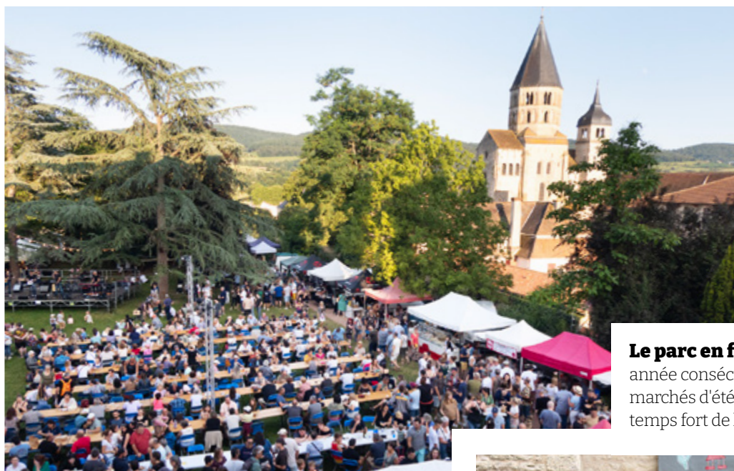
Le parc en fête Installés pour la deuxième année consécutive au parc abbatial, les marchés d'été s'annoncent comme le vrai temps fort de la saison estivale clunisoise !