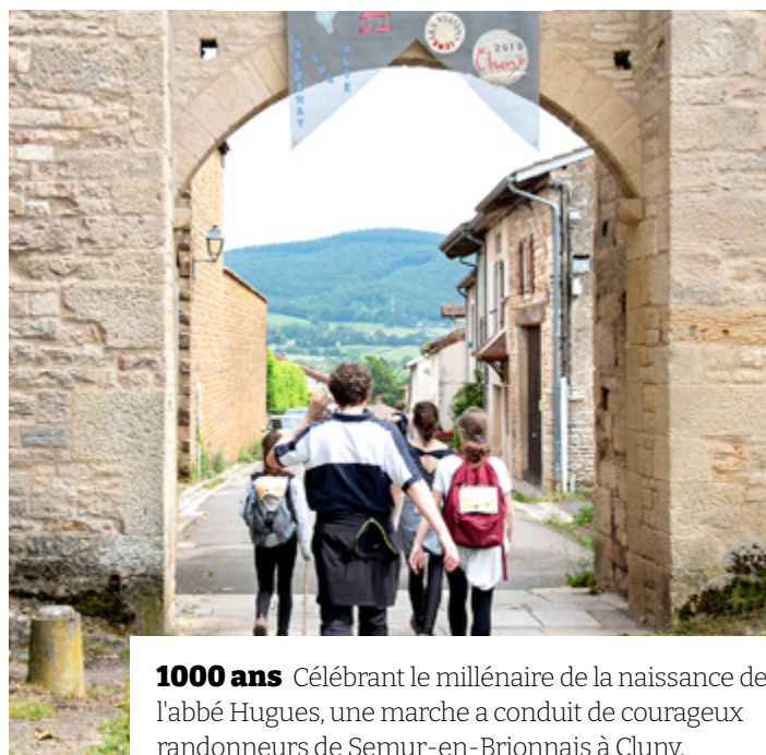
1000 ans Célébrant le millénaire de la naissance de l'abbé Hugues, une marche a conduit de courageux randonneurs de Semur-en-Brionnais à Cluny.