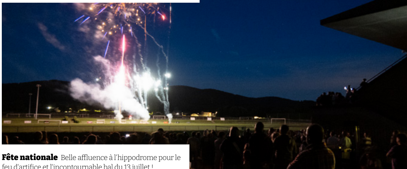
Fête nationale Belle affluence à l'hippodrome pour le feu d'artifice et l'incontournable bal du 13 juillet !