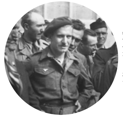
Archives municipales de Cluny

Pour l'effet de surprise c'est raté puisque le renseignement a déjà parfaitement rempli sa mission. Cluny est en alerte et organise sa défense. Depuis son PC du hameau des Vernes à l'est de la ville, le commandant Laurent (Bazot), à la tête du régiment de Cluny, s'interroge : les allemands attaqueront-ils par Azé ? Le Bois Clair ? Bourgvilain ? Les trois simultanément ? Des compagnies prennent position sur les hauteurs couvrant la ville et au carrefour de la Valouze. D'autres restent en attente à Cluny pour intervenir en cas de besoin sur l'un des secteurs.