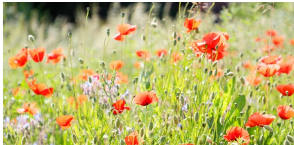
▲ Une jachère fleurie aux Jardins d'Avril