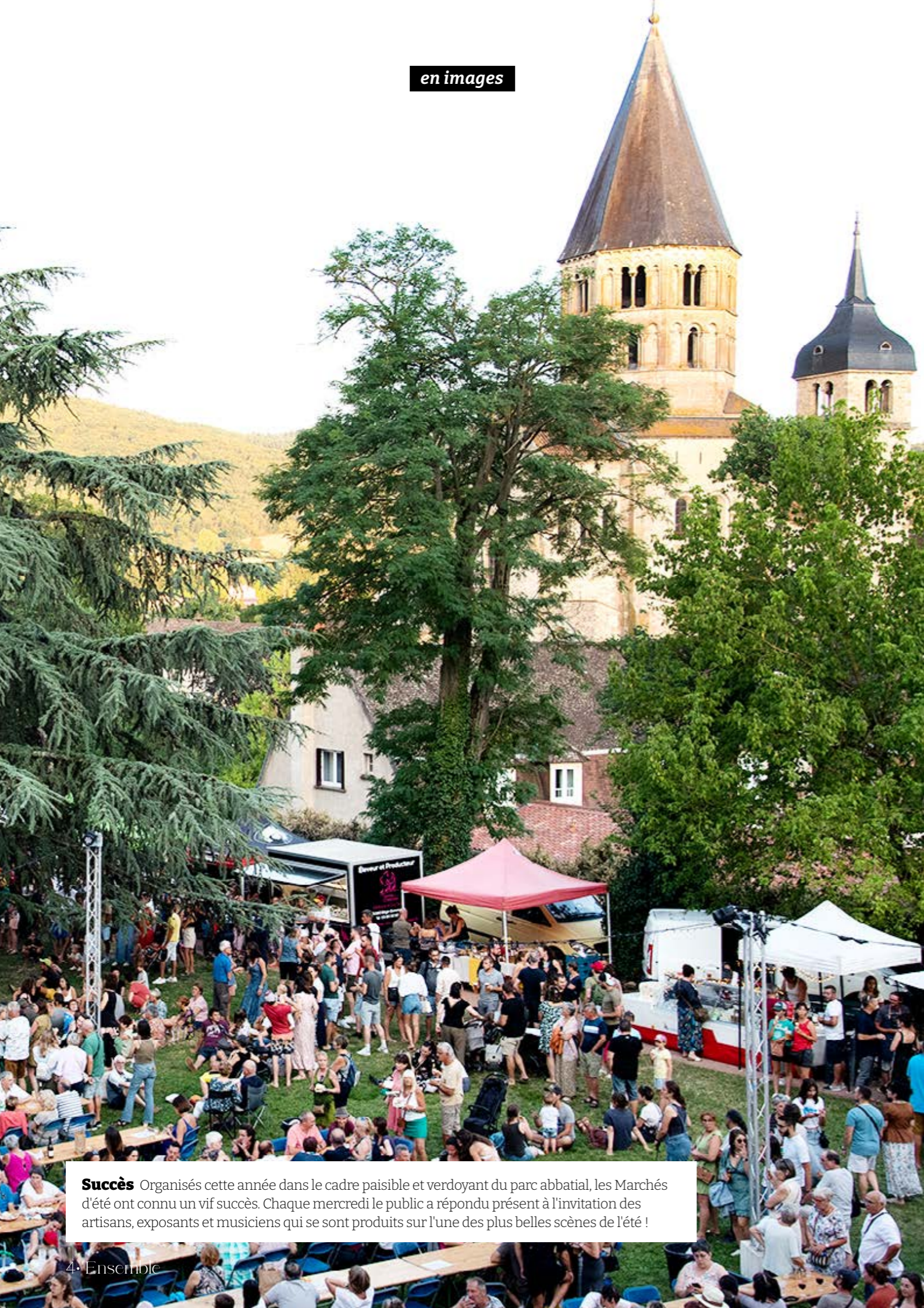
Succès Organisés cette année dans le cadre paisible et verdoyant du parc abbatial, les Marchés d'été ont connu un vif succès. Chaque mercredi le public a répondu présent à l'invitation des artisans, exposants et musiciens qui se sont produits sur l'une des plus belles scènes de l'été !