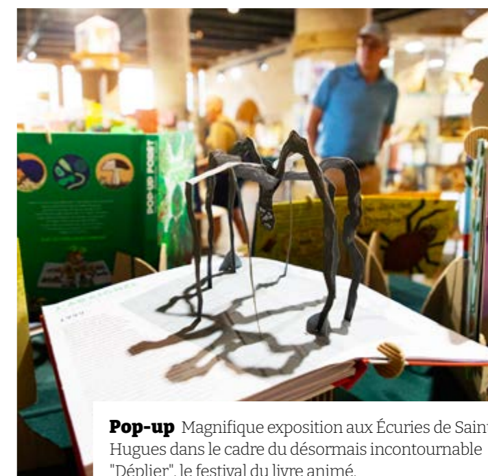
Pop-up Magnifique exposition aux Écuries de Saint-Hugues dans le cadre du désormais incontournable "Déplier", le festival du livre animé.