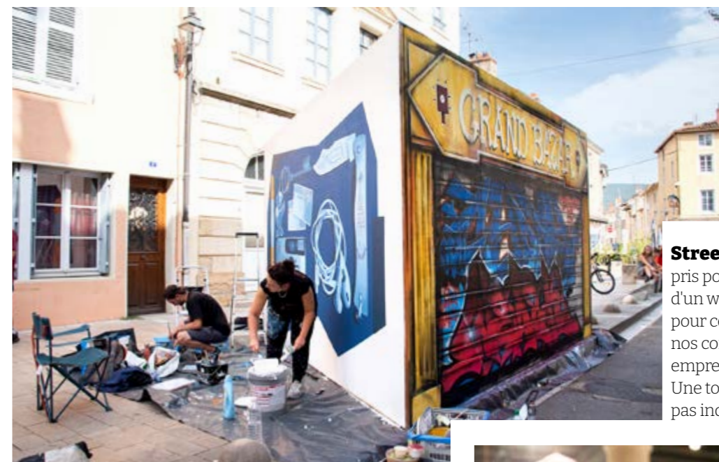
Street Art Fest Les graffeurs ont pris possession de la ville le temps d'un week-end. Un nouveau festival pour célébrer l'art urbain initié par nos commerçants qui laisse une belle empreinte sur quelques murs de la cité. Une touche de modernité qui ne laisse pas indifférent !