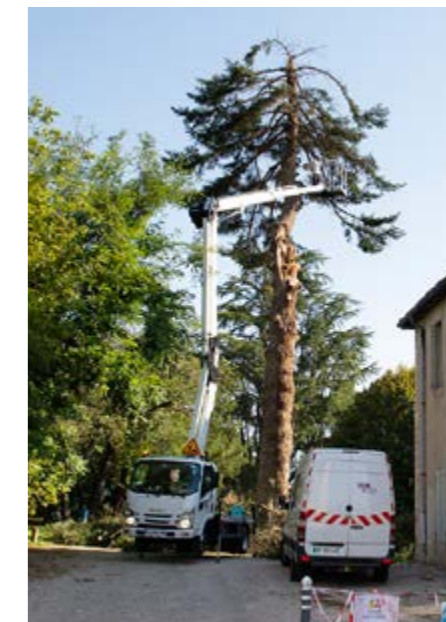
▲ Trop fragilisé par la chute d'une de ses branches, ce sapin d'Espagne vieux de 70 ans a dû être abattu.

L'arrivée au parc par le narthex ou les portes d'honneur s'accompagne désormais d'une sensation de vide. Le muret qui surplombe le Jardin de Simples et le Baraban nord, plébiscité autrefois des visiteurs en quête d'un moment de calme, paraît aujourd'hui bien seul. Le cèdre majestueux qui l'ombrageait s'est couché pendant l'orage, brisant dans sa chute des sapins voisins. Un peu plus loin, au fond du parking de la mairie, c'est une grosse branche du magnifique sapin d'Espagne qui s'est détachée du tronc. Trop fragilisé, l'arbre installé il y a plus de soixante-dix ans a dû être abattu. Difficile d'énumérer l'intégralité des arbres endommagés. On citera quand même le bel arbre de Judée près du belvédère de l'abbaye qui n'a pas résisté à la tempête et ne teintera plus de rose l'arrivée du printemps. Il aura fallu plus d'une semaine et l'annulation d'un marché d'été pour qu'agents du centre technique municipal et entreprises spécialisées parviennent à dégager et sécuriser le parc. La réflexion et la concertation s'engagent cet automne pour prévoir de nouvelles plantations en 2024. Les arbres devront être choisis pour leur aptitude à résister aux assauts du climat. Pour les usagers du parc, il faudra patienter de longues années avant de profiter de leur ombre et d'admirer la beauté de leur feuillage.