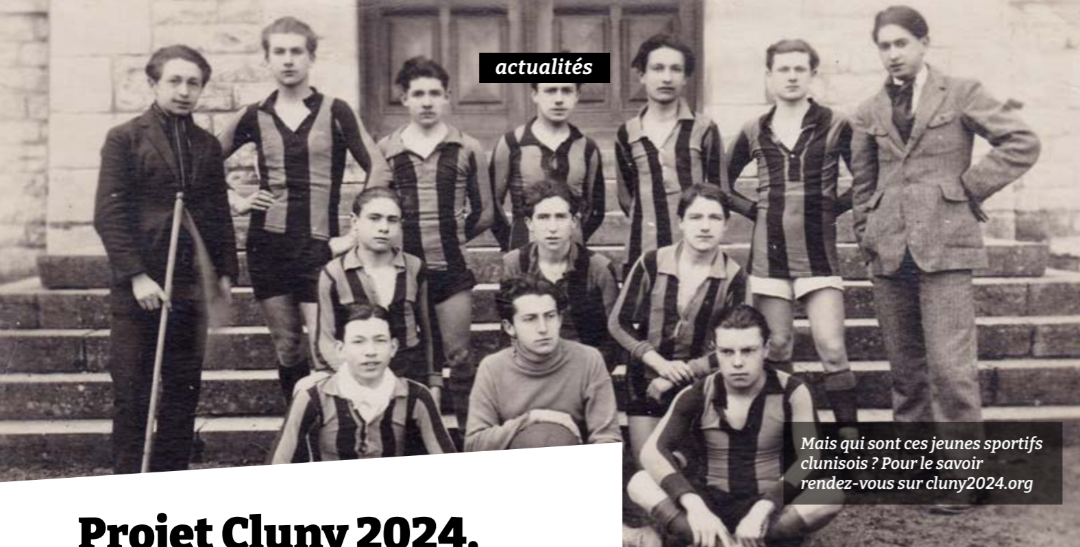
Mais qui sont ces jeunes sportifs clunisois ? Pour le savoir rendez-vous sur cluny2024.org