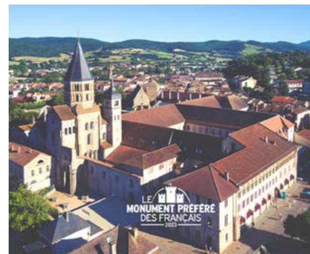
Médaille d'argent L'abbaye obtient une superbe 2 e place au classement de l'émission "Le monument préféré des Français". N°2 pour les Français en 2023 mais éternellement n°1 pour les Clunisois !