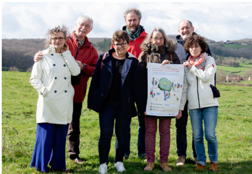
Une partie du collectif de futurs habitants de l'habitat participatif